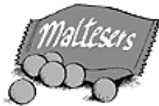
SIE ERNÄHREN SICH VON SCHOKOKUGELN