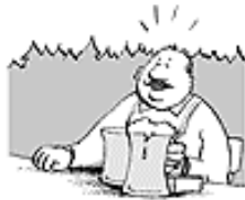
TSCHECHEN TRINKEN GIERNE BIER