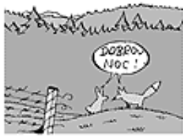
TSCHECHIEN IST EIN NÖRDL. WALDGEBIET