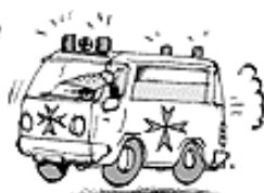
ANSONSTEN SIND SIE BELIEBTE SANITÄTER