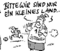
& SPIELEN NUR ETWA 300X BESSER FUSSBALL, ALS WIR.