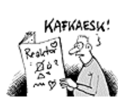
NACH DEREN PLÄNEN EIGENE WÖRTER BENANNT WERDEN