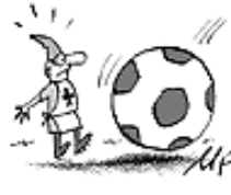
UND FUSSBALL- GEGNER