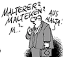
KEIN MENSCH WEISS WIE DIE HEISSEN.