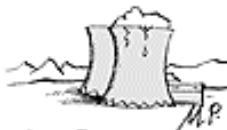
UND BAUEN DANN ATOMKRAFTWERKE.