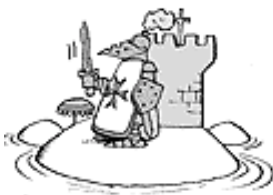
MALTA IST EINE RITTER- INSEL IM MITTELMEER.