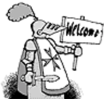
AUS IHRER SICHT TRIT 2004 DIE EU MALTA BEI