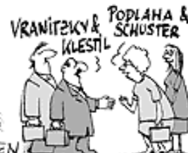
SIE TRAGEN SELTSAAME NAMEN